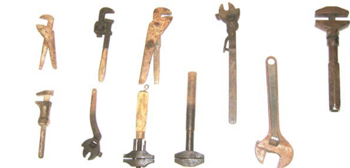
Collezione OMG, chiavi inglesi.